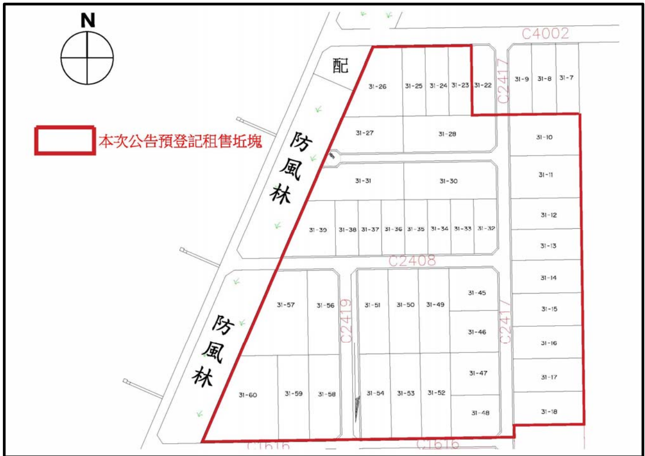
附圖1、彰濱工業區鹿港區西三區一期產業用地(一)土地坵塊劃分圖