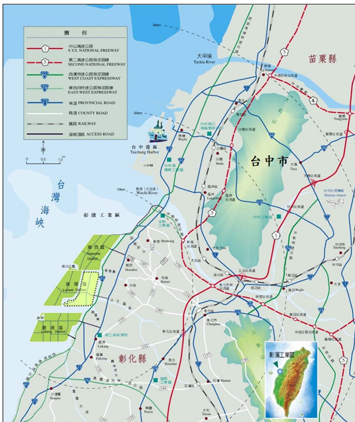
彰濱工業區鹿港區位置圖